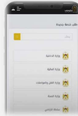
تطبيق حكومتي Android and iOS